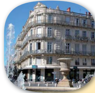
Montpellier. Lauréats occupe le 1 er étage de l'immeuble.